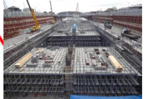
③矢切地区函渠工事