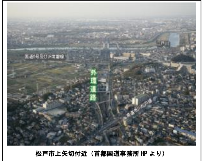
松戸市上矢切付近