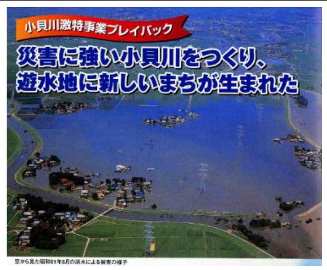
母子島遊水地（はこじまゆうすいち）

昭和 61 年（1986 年）8 月の小貝川大洪水から 26 年。150 年に一度の大洪水といわれ、その被害は、旧下館市の面積の 4 分の 1 を冠水させ、下流の旧明野町でも谷原、大林地区など小貝川沿いの地域を泥水の海に変えました。かつて経験したことのない大きな被害に自然の猛威を思い知らされました。観測史上最悪の被害を受けた小貝川は、昭和 61 年 9 月、建設省（現 国土交通省）の直轄河川激甚災害対策特別緊急事業の採択を受け、小貝川中流部約 10 km の堤防補強、小貝川大橋の架け替え工事、そして母子島遊水地の建設が行われ、総事業費 208 億円、工期が 5 か年という大規模かつ緊急の事業でした。今回は、堤防決壊現場と母子島遊水地を訪ね、当時の被害状況と復興のあゆみ振り返ります。