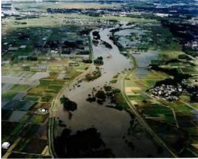
小貝川の洪水時の状況